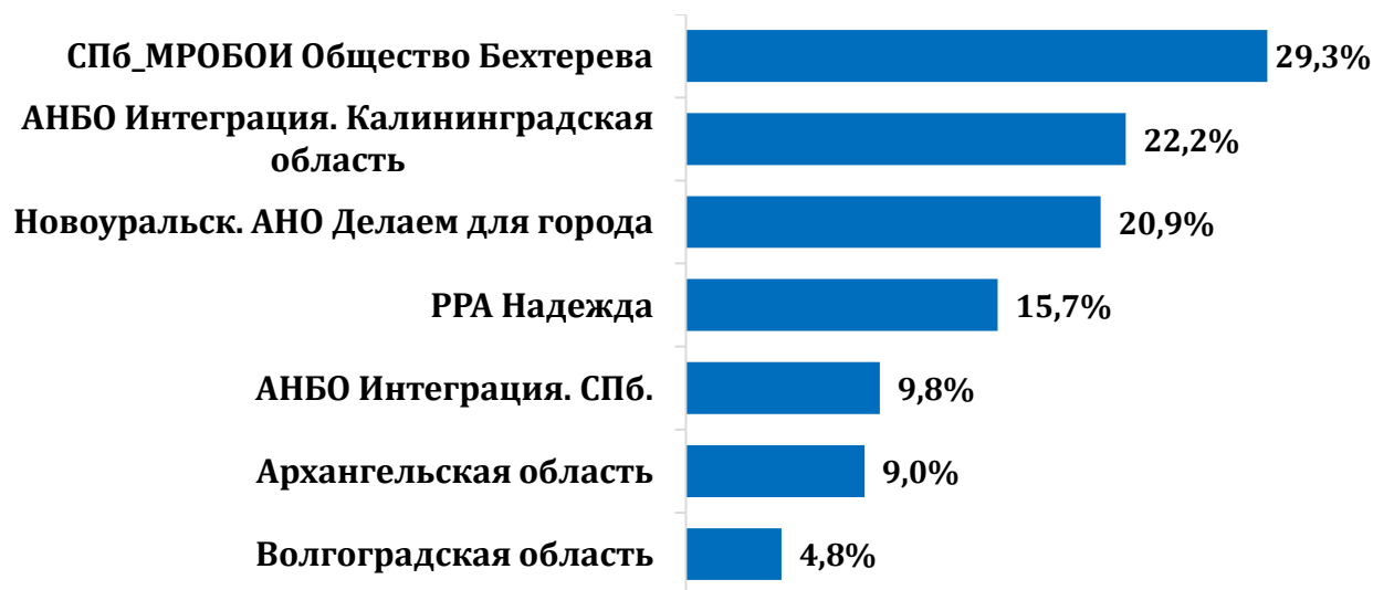
Рис. 2. Изменения среднего значения индекса ответственности пациента до и после участия в мероприятиях в рамках 3-й модели по регионам – участникам проекта [3]

ло резко увеличить результативность работы с благополучателями, что продемонстрировали результаты мониторинга.