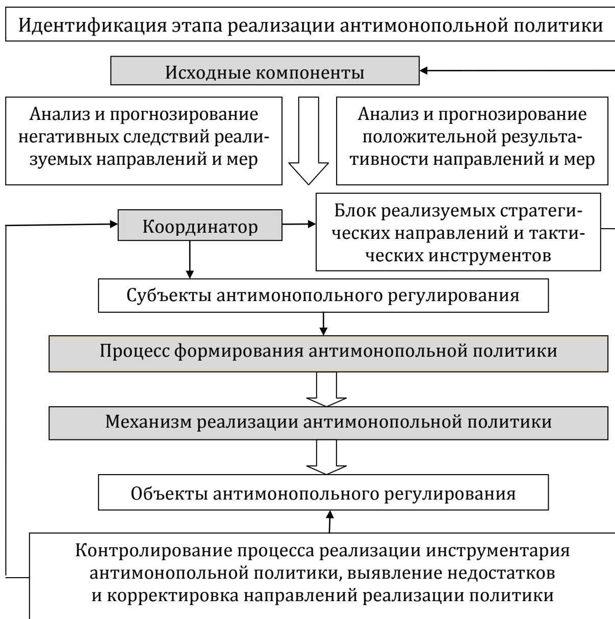
Рис. 2. Механизм разработки и реализации антимонопольной политики в соответствии с координационным подходом

Содержание данного механизма потребует уточнения для конкретного этапа развития экономической системы и результативности реализации в ней антимонопольного регулирования. К примеру, конкретизация представленного механизма разработки и реализации антимонопольной политики на этапе кризисного состояния антимонопольного регулирования состоит в уточнении порядка реализации основных направлений, разработке стратегических направлений и тактического инструментария.