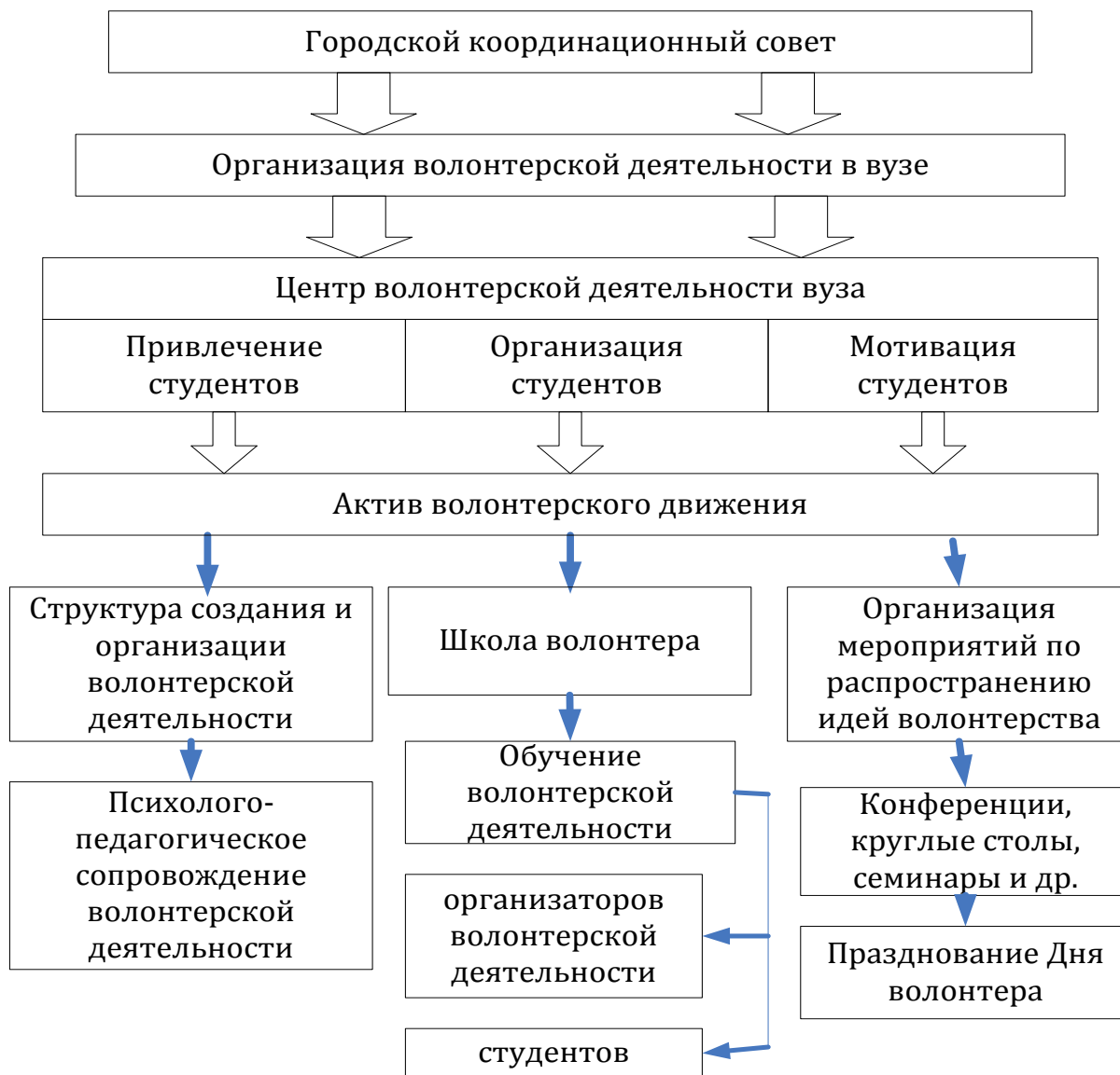
Рис. 2. Структура организации волонтерской деятельности в вузе

ляющими структурами вузов. В функциональные обязанности данного совета целесообразно включить организацию обучения волонтеров. На основе предлагаемых С. В. Львовой [3] составляющих элементов волонтерской деятельности вуза можно представить структуру данного движения в образовательной организации, которая показана на рисунке 2.