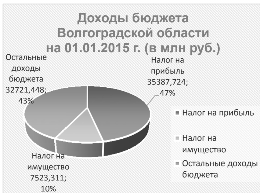
Рис. 1. Анализ доходов бюджета Волгоградской области на 01.01.2015 г. [2]

В Волгоградской области общий объем государственной поддержки субъектам инвестиционной деятельности не может превышать стоимости инвестиционного проекта, предоставляется на срок не более 5 лет при условии выполнения ряда социально-экономических показателей [15]. Налоговые льготы для инвесторов предоставляются только по налогу на прибыль и налогу на имущество организаций [13, 12]. На рисунке 1 можно увидеть, какую долю в общем доходе бюджета составляют именно эти налоги.