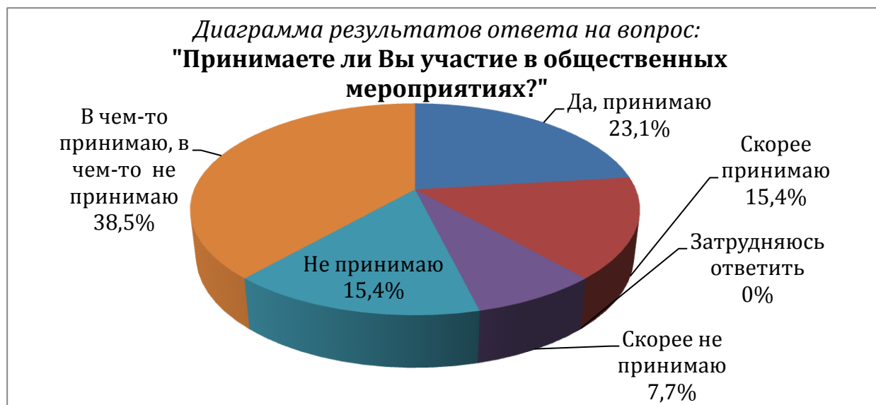
Рис. 1. Вовлеченность молодежи муниципалитетов в общественные мероприятия

2. Наиболее часто упоминаемые источники, из которых молодые люди получают информацию о предстоящих мероприятиях, распределились следующим образом: на первом месте — товарищи и друзья (69,6%), на втором — СМИ (61,5%), на третьем — Интернет (38,5%).