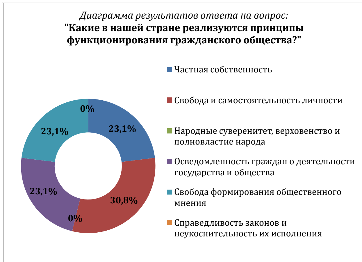
Рис. 3. Реализация принципов функционирования гражданского общества

ва?» большинство молодых людей выбрало в качестве ответа — принцип индивидуальной свободы и самостоятельности личности (30,8%). В то же время опрос выявил отсутствие среди респондентов выбора принципов народного суверенитета и справедливости законов (рис. 3).