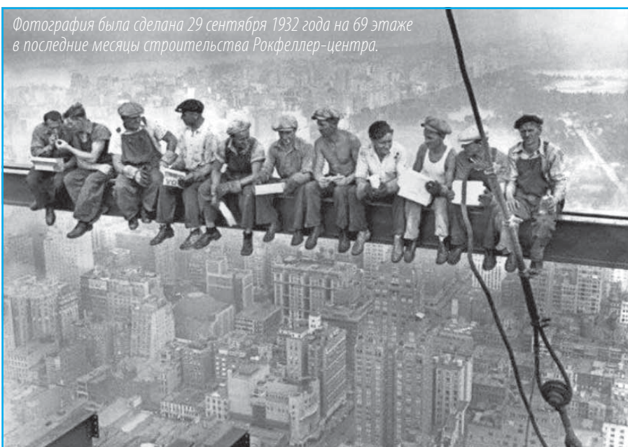
Фотография была сделана 29 сентября 1932 года на 69 этаже в последние месяцы строительства Рокфеллер-центра.