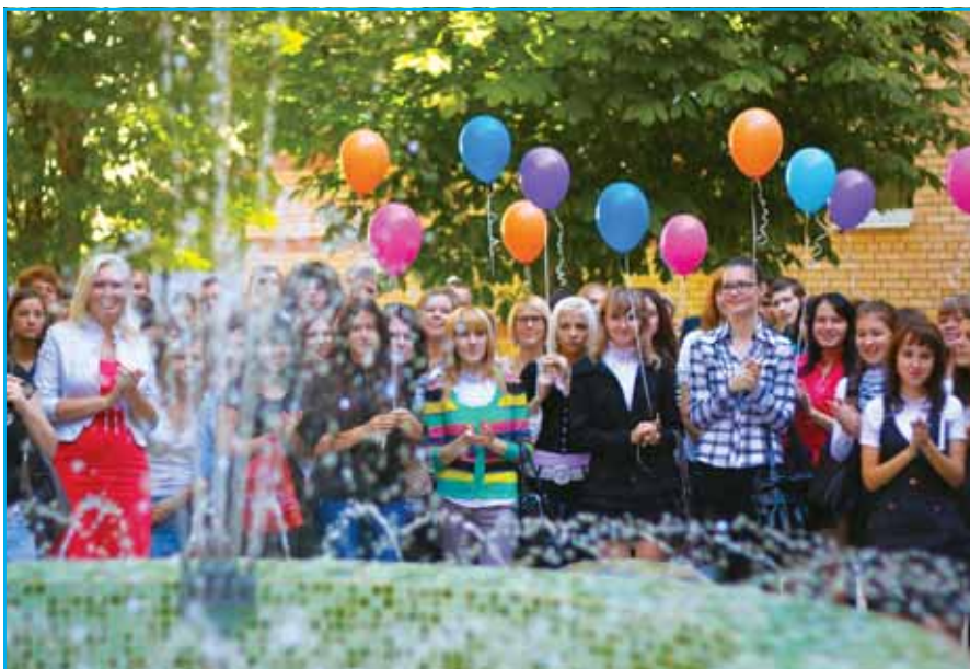
Фотоотчет «День знаний» на стр. 2 ⇒